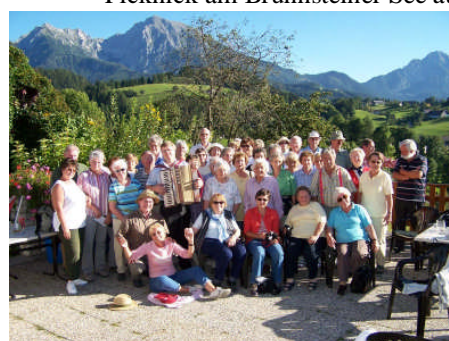
und schie war's beim Moosgierler