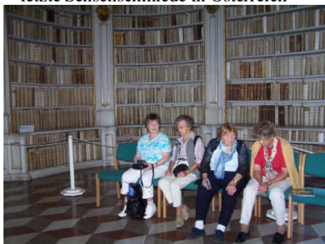
in der Admonter Bibliothek