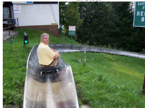
Rodeln am Wurbauerkogel