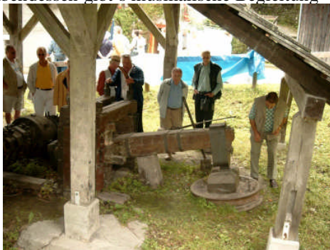
letzte Sensenschmiede in Österreich