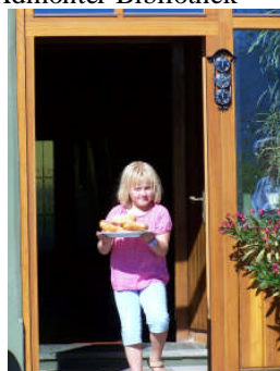
Auzog'ne beim Moosgierler