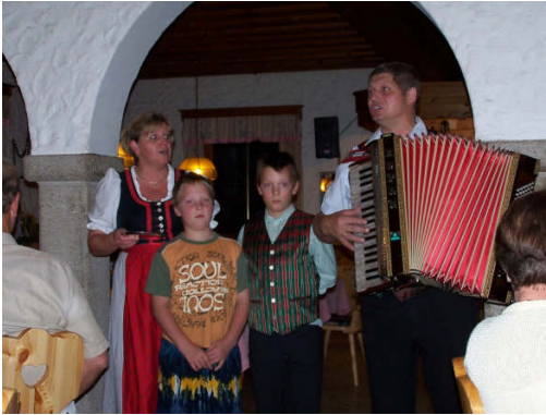
zum Abendessen gibt's musikalische Begleitung