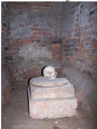
Hungerturm im Schloß Orth

Gott sei Dank war uns das Wetter immer wohlgesinnt und auch die Wege angenehm, manchmal anstrengend aber immer lohnend. Als fast sämtliche Filme aufgebraucht waren sind wir über den „Bodensee“, einem kleinen wildromantischen Bergsee mit herrlicher Fischzucht, wieder nach München zurückgekehrt.